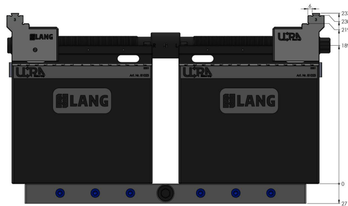
Die oben gekennzeichneten Werte gelten auch für die Einheiten mit den Längen 610 & 810 mm