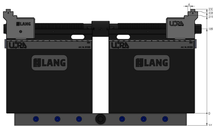
Die oben gekennzeichneten Werte gelten auch für die Einheiten mit den Längen 610 & 810 mm